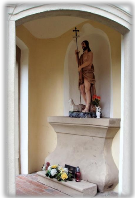
Obrázok 4: Kaplnka sv. Jána Krstiteľa v Horných Lefantovciach

V roku 1369 do obce prišli mnísi rehole pavlínov (rehoľa bratov sv. Pavla založenej v Uhorsku) a v osade Sanctus Johannes (zal. 1353) vybudovali Kláštor sv. Jána Krstiteľa.