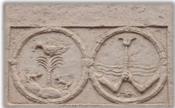
Obrázok 5: Erb rádu pavlínov z roku 1630 na múre hornolefantovského kaštieľa