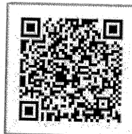
QR Platba VUB,a.s.

Špecializovaná nemocnica sv. Švorada Zobor, n.o. - 9 -12- 2021 Nemocničná lekáreň