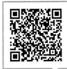
QR Platba VUB, a.s.