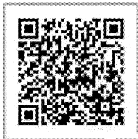
QR Platba SLSP, a.s.