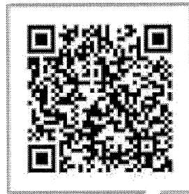
QR Platba VUB, a.s.